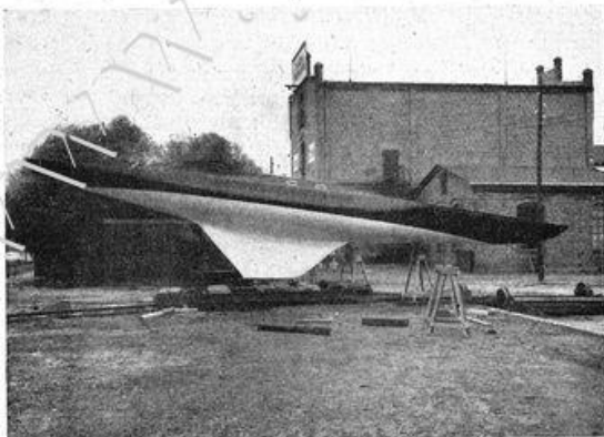
40 qm-Schärenkreuzer Saga. Entworfen von Neesen, erbaut auf der Pabstwerft.

In der 35 qm-Klasse, wo Emmy und Limit fehlten, legte der von seinem Konstruktor gesteuerte Dico am Start den Grundstein zu seinem ersten Erfolg. Tief in Lee mit Fahrt den anderen enteilend, hatte er bis zur Seddinboje bereits 4 Min. vor Miene, und 4 Min. 13 Sek. vor Scharmützel in der Hand, während der Rest in der Ordnung: Dubrow, Rackerle, Elisabeth und Hannerl mit zum Teil beträchtlich grösserem Abstand folgte. Auch der zweite Rundgang ergab die gleiche Ordnung, bis auf dem Heimweg Scharmützel an